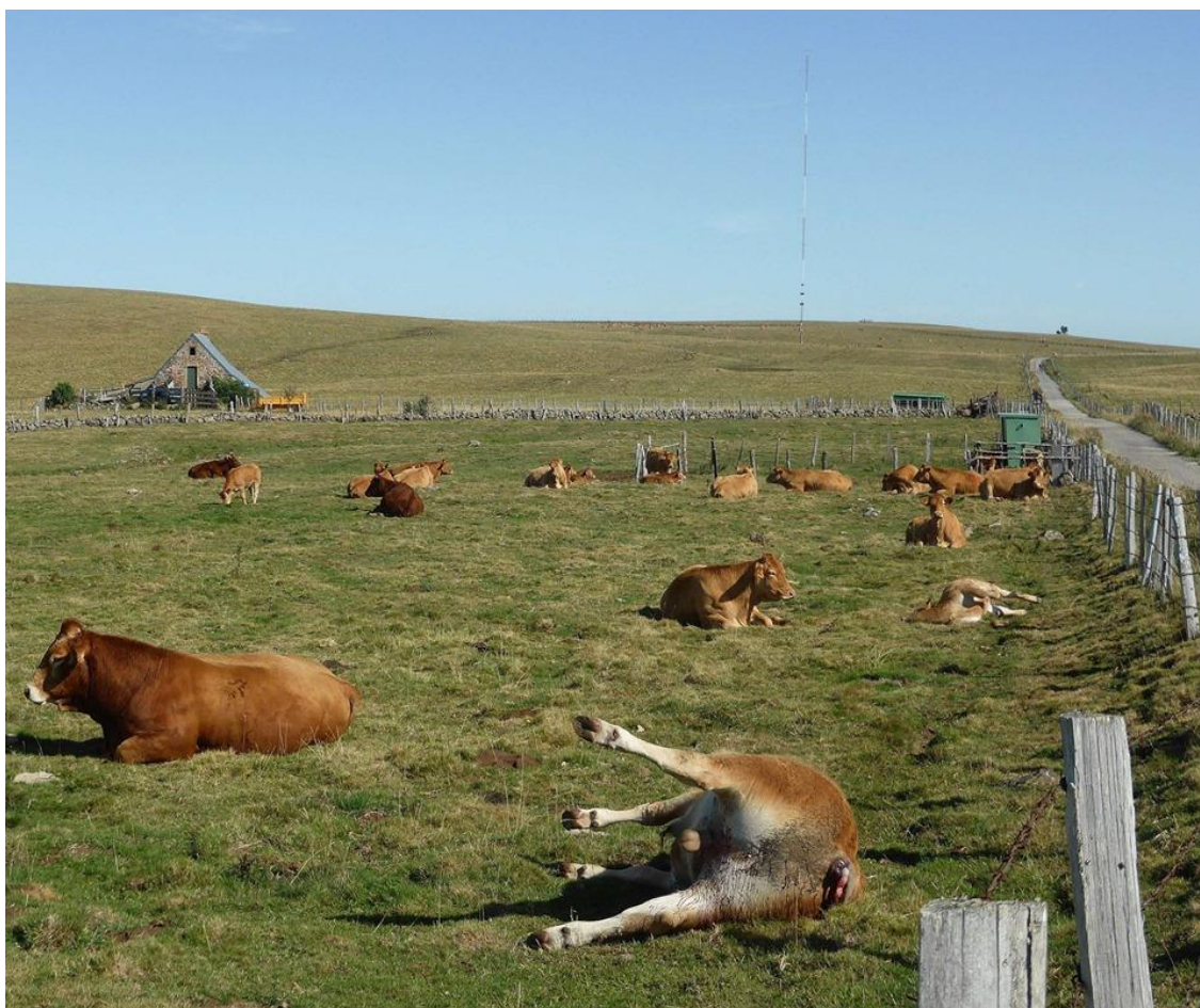
Fig. 1 : 3e veau mort et sa mère aussi allongée à côté ...

Bien entendu, les mâts de mesures métalliques (celui de la planèze de Trizac mesure 84 m de haut) sont équipés de paratonnerre, dont le but est d'attirer la foudre (décharge électrique de plusieurs millions de volts) et la répartir dans le sol via les câbles qui les y relient. Mais si des animaux - ou des humains - se trouvent à proximité des câbles enfouis, ils reçoivent la décharge foudroyante et meurent sur le coup 9 fois sur 10.