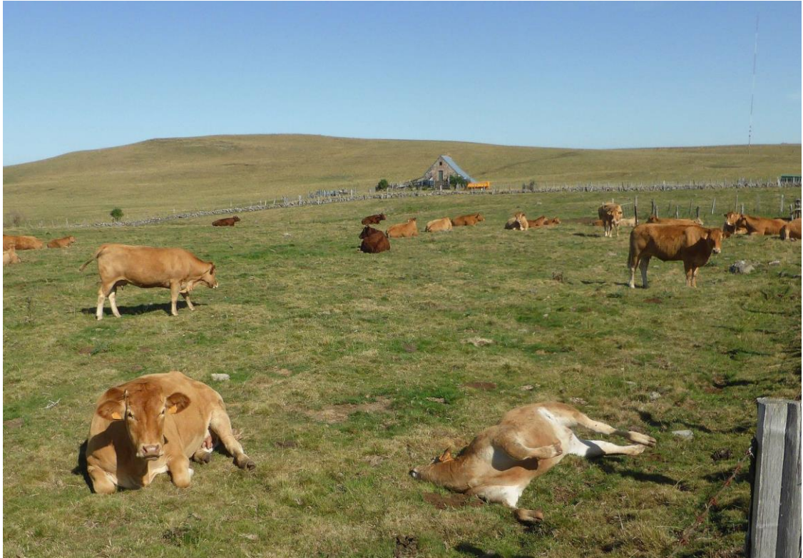
Fig. 2 : 2e veau mort, et sa mère qui le veille, le mât de mesure est visible au fond à droite. Je vous passe les scènes émouvantes de la vache léchant désespérément son petit de quelques mois