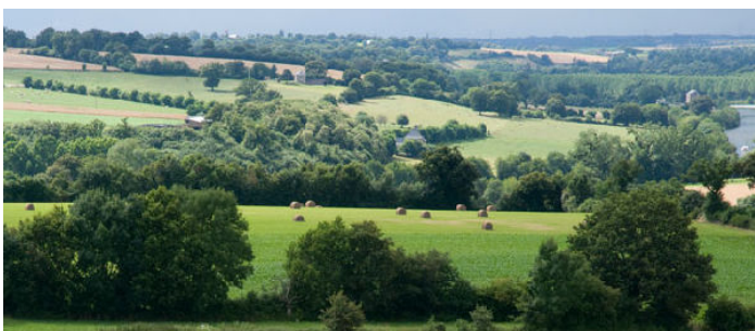
Le Boischaut Sud de l'Indre

Notre étude confirme les différents travaux présentés dans cet article : les touristes sont attirés en Brenne et Boischaut pour profiter des paysages ruraux et des derniers espaces naturels préservés, flore, faune, qui ont échappé à l'urbanisation et à l'artificialisation des terres.