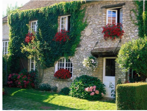
Résidences secondaires : atout majeur pour le tourisme

Le tourisme occupe en France une place majeure : plus de 2 millions d'emplois, près de 7,5% du PIB, environ 10 milliards d'euros de contribution à la balance commerciale. Liée en grande partie au patrimoine des territoires (naturel, paysager, culturel, industriel, urbain...), cette activité repose plus que d'autres sur une étroite coopération public-privé et, plus largement, sur la mobilisation de ses multiples acteurs : collectivités et satellites, Etat, opérateurs, associations et, de plus en plus, consommateurs [8]. "Le cœur des territoires bat donc au rythme du tourisme..." . L'économie territoriale privilégie traditionnellement deux approches.