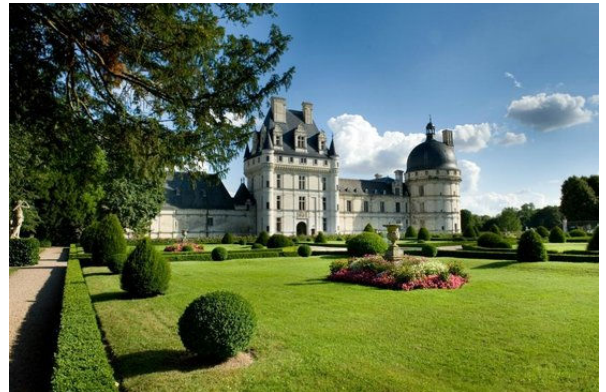
Château de Valençay

Enfin, cette contribution vise à préciser les attentes des acteurs liés au tourisme et les besoins qu'ils engendrent au regard des politiques d'aménagement du territoire et des services publics, de valorisation de l'environnement ou encore du cadre de vie.